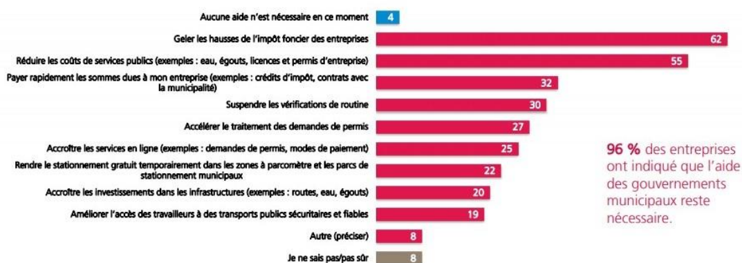
Figure 2 : Parmi les mesures d'aide suivantes destinées aux entreprises, lesquelles votre municipalité devrait-elle privilégier en ce moment ?

Source : FCEI, La COVID-19 et votre entreprise – Sondage numéro neuf, 8 au 13 mai, 5 939 répondants, marge d'erreur \pm 1,3 %, 19 fois sur 20.